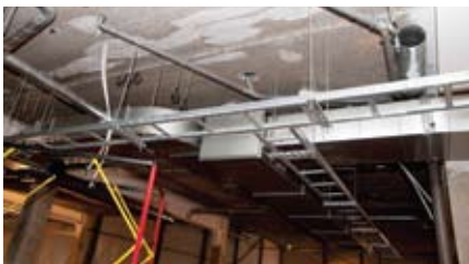
Установленные водосточные и вентиляционные системы.

Группа компаний «Litana» на строительстве объектов все чаще исполняет роль генерального подрядчика. Ранее работы по установке инженерных систем передавались субподрядчикам, теперь же эти работы в Республике Беларусь группа «Litana» может выполнять своими силами, так как с 1 марта текущего года в группе начал работать отдел инженерных систем.