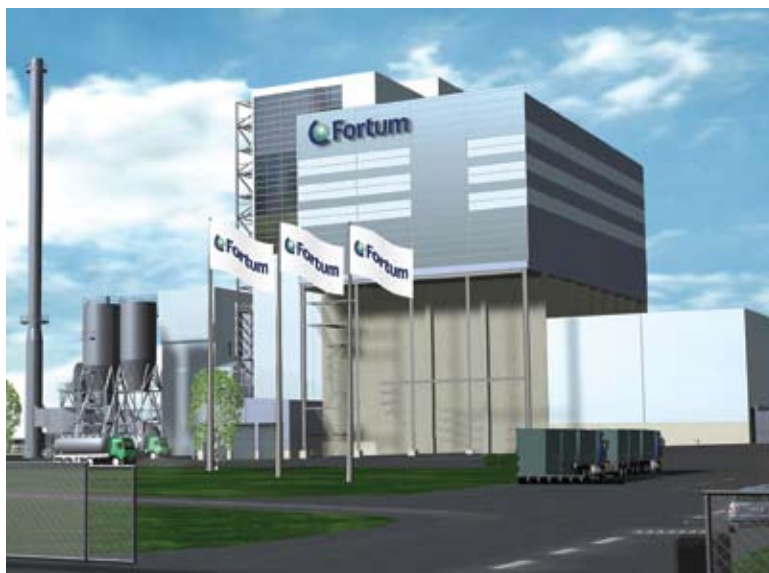
Макет термофикационной электростанции

Планируемое начало эксплуатации термофикационной электростанции – первое полугодие 2013 года.