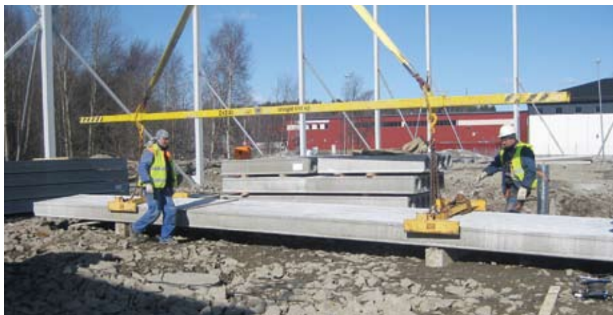
Строительство склада логистики в Швеции.

В Норвегии начнутся строительные работы торгового центра.