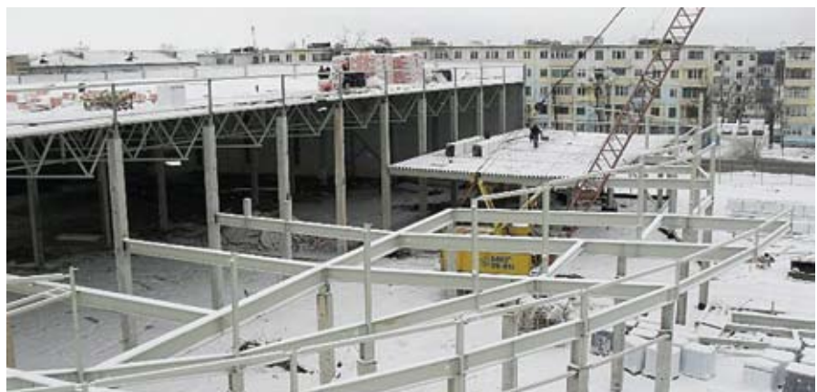
Строительство торгово-развлекательного центра в городе Солигорск (Республика Беларусь).

В Норвегии продолжатся работы по строительству гимназии и ресторана.