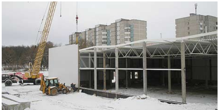
Строительство супермаркета в Гродно (Республика Беларусь).